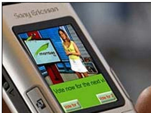
Abbildung 1; Quelle: Sony Ericsson.

Der Markt mit Endgeräten für mobiles Fernsehen ist prinzipiell identisch mit dem Markt für Mobiltelefonen und PDAs.